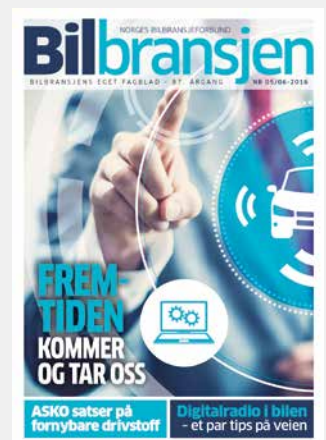
To av bladet Bilbransjens utgaver i 2016.