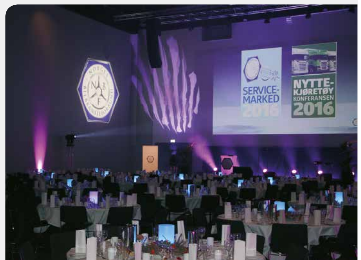
Klart for festmiddag under Servicemarked 2016.

Konferansen fikk høy score på innhold og gjennomføring både fra deltakere og utstillere.