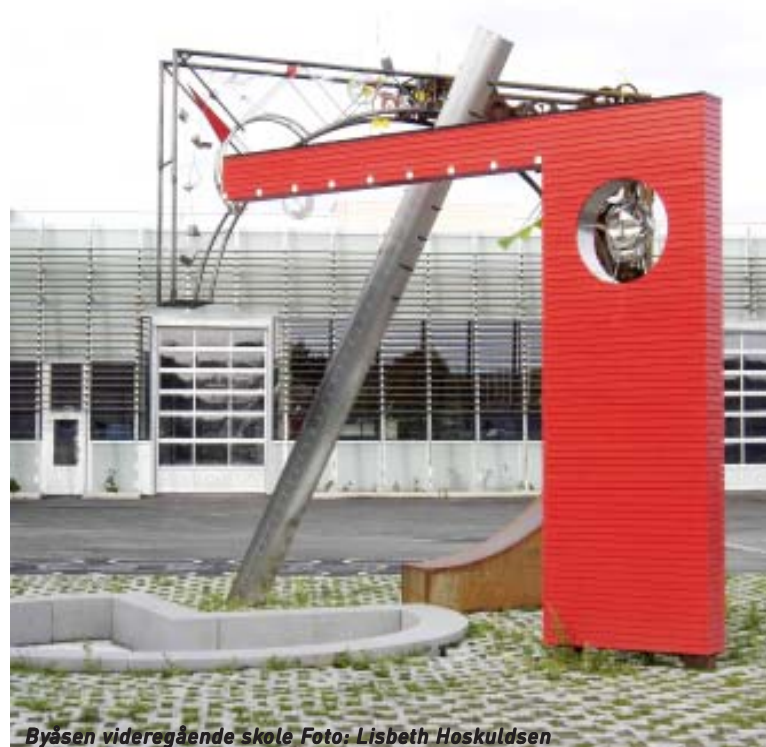
Byåsen videregående skole

Bilbransjens ønske om å utvikle et tilbud om en etterutdanning med en enhetlig, nasjonal standard, har vært utgangspunkt for dette prosjektet. NBF fikk tildelt økonomisk støtte fra Kompetanseutviklingsprogrammet (KUP) for å gjennomføre prosjektet. To prøveprosjekter skal gjennomføres i 2005. Førde Tekniske Fagskole har ansvar for gjennomføring av det ene prøveprosjektet, Servicetekniker, mens det andre skal gjennomføres av Byåsen videregående skole i Trondheim.