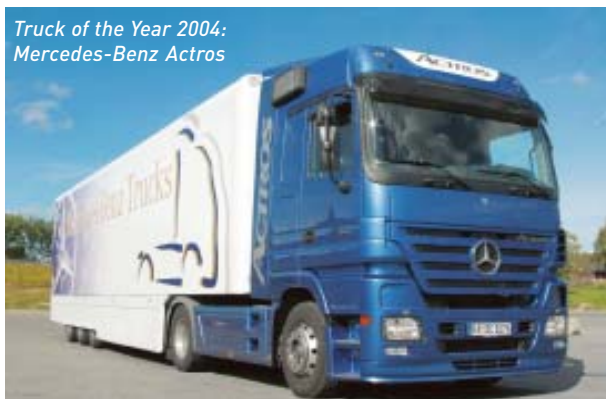
Truck of the Year 2004: Mercedes-Benz Actros

Salget av nye varebiler ble 30 994, som representerer en økning på 28,3 % i forhold til 2003.