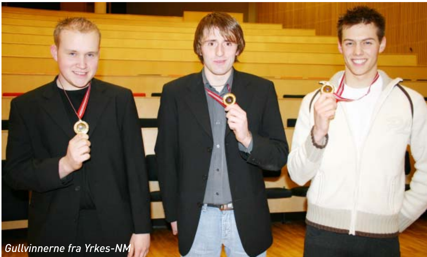
Gullvinnerne fra Yrkes-NM