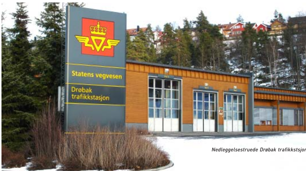
Nedleggelsestruede Drøbak trafikkstasjon

Bilbransjen trenger tilbudet fra tollstedene i forbindelse med taxiregistreringer og ved ombygginger som gir høyere engangsavgift. Minst 15 tollsteder er imidlertid nedlagt, og dette skaper ulemper og økte kostnader for endel bilforhandlere. 6 regiontollsteder kan fortsatt utføre nevnte tjenester, men det var uklart om de ca. 24